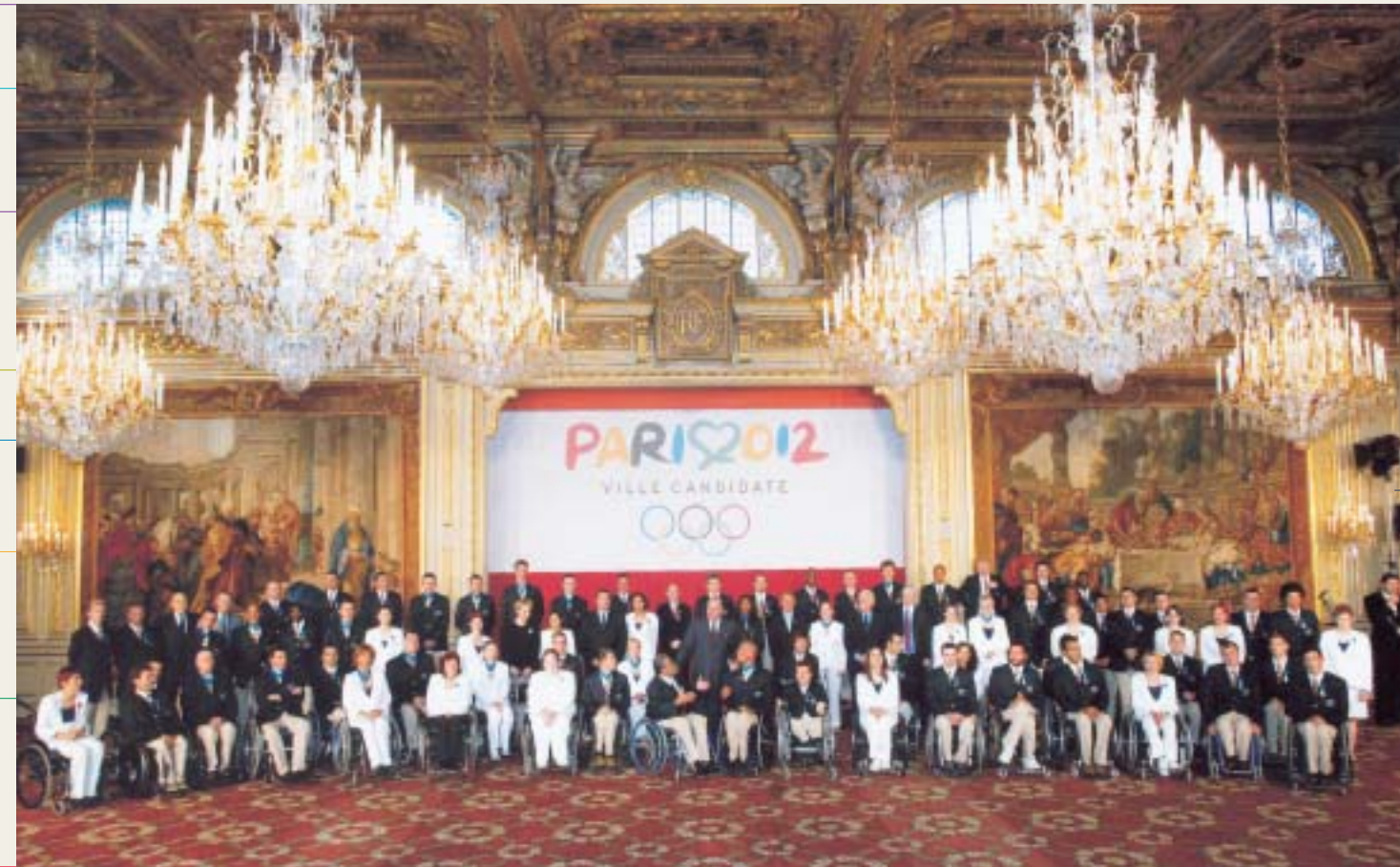
Jacques Chirac, président de la République française, honore les athlètes français médaillés aux Jeux Paralympiques d'Athènes.