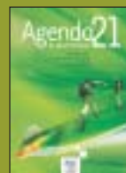
Agenda 21 du sport français.

L'ensemble de ce dispositif constitue une bonne base de travail pour préparer la mise en place du CNDS dont les modalités de fonctionnement