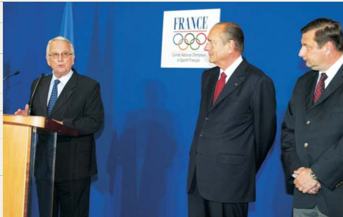
À 100 jours des JO d'Athènes.