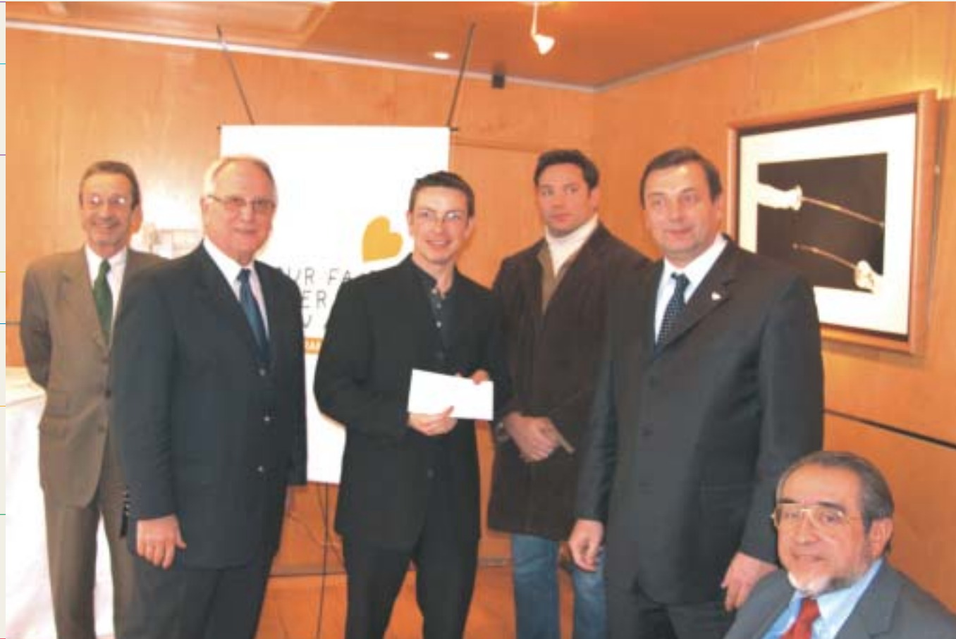
Remise du chèque d'un million d'euros en faveur des quatre associations (Croix-Rouge - Coordination Sud - Sport sans frontières - UNICEF).