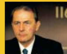
Jacques Rogge et Henri Sérandour lors de la 116 e session du CIO à Athènes.