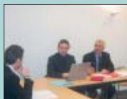
Une conciliation au CNOSF.

Pour tous les autres, les parties n'ont pas manifesté la volonté de poursuivre devant les juridictions la contestation de la décision fédérale. On peut dès lors supposer que, même si la proposition n'a pas reçu leur total assentiment, l'avis émis par le conciliateur dans le cadre de la procédure les a incitées à ne pas donner de suite contentieuse à leur conflit.