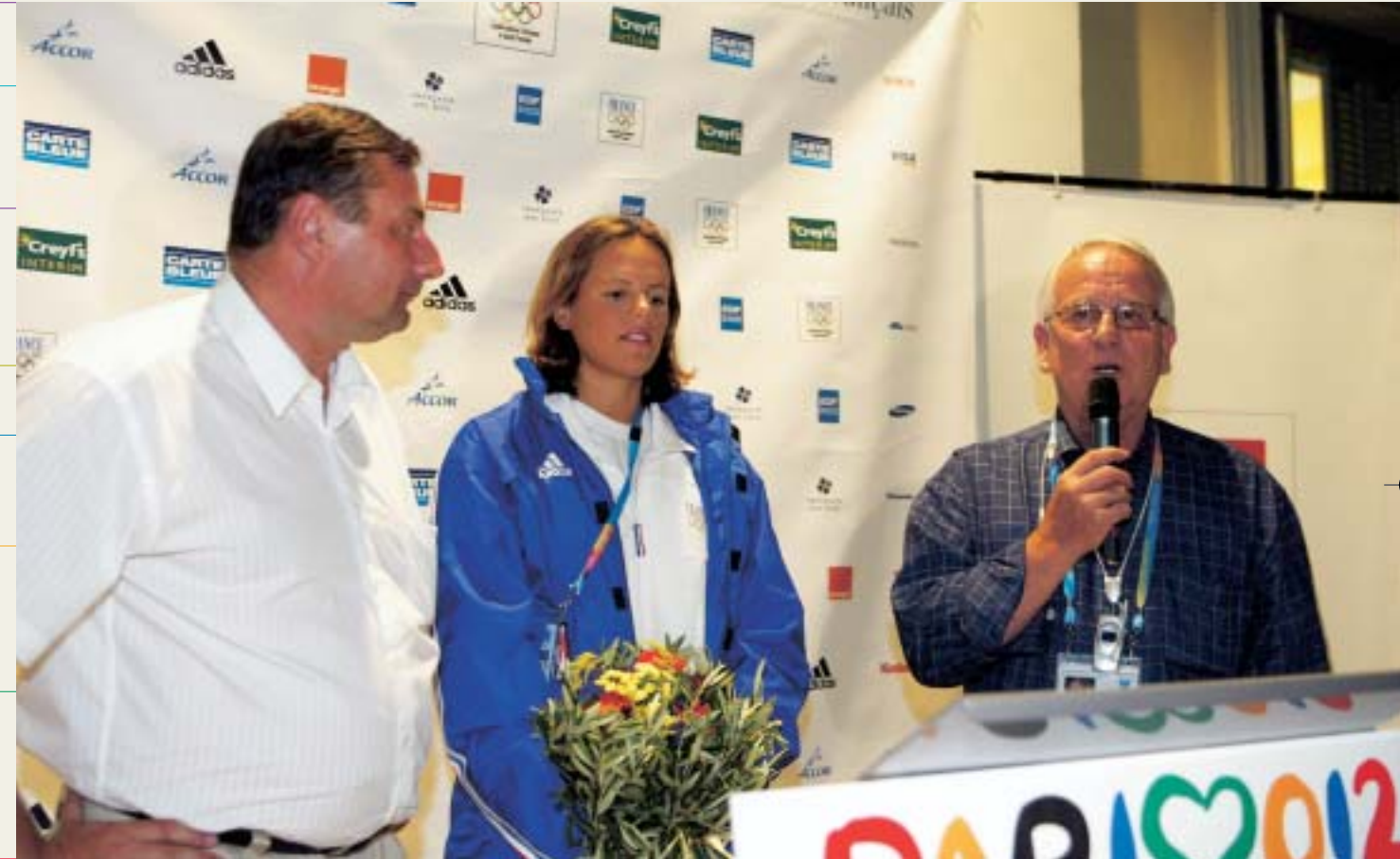
Laure Manaudou, championne olympique du 400 m nage libre aux JO d'Athènes 2004.