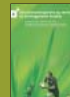
Identité graphique Agenda 21.