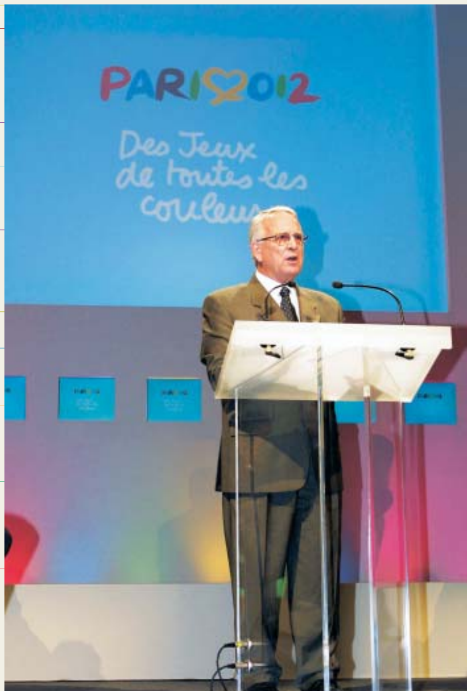
Le mouvement sportif se mobilise pour obtenir les JO à Paris, en 2012.