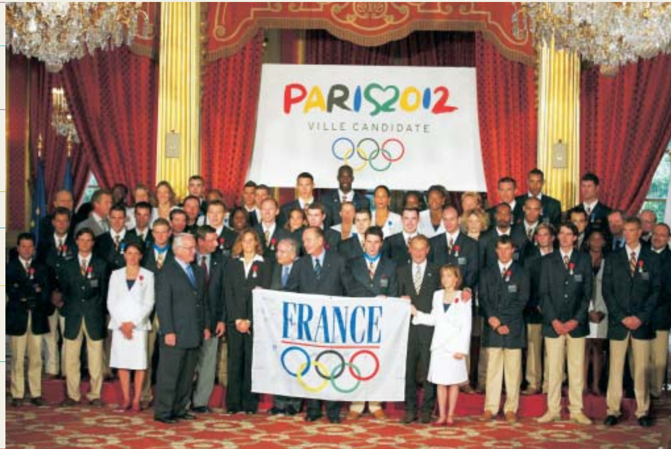
Jacques Chirac, président de la République française, honore les athlètes français médaillés aux Jeux Olympiques d'Athènes.